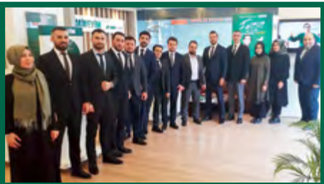
1. İSTANBUL / ŞİRİNEVLER ŞUBE

İşte kademeler bazında yapılan sıralamaya göre Ekim ayının şampiyon şubeleri;