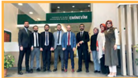
2. BURSA / YILDIRIM ŞUBE