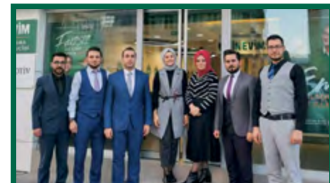
7. KAYSERİ / İSTASYON ŞUBE