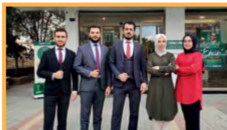
6. ANTALYA / ALANYA ŞUBE