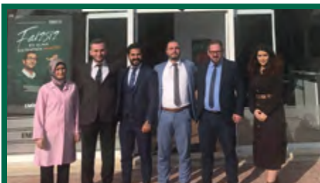
5. BURSA / NİLÜFER ŞUBE