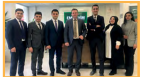
4. ANKARA / SINCAN ŞUBE