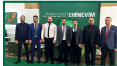
3. İSTANBUL / ESENERLER ŞUBE