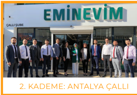
2. KADEME: ANTALYA ÇALLI