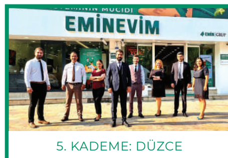
5. KADEME: DÜZCE