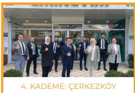
4. KADEME: ÇERKEZKÖY