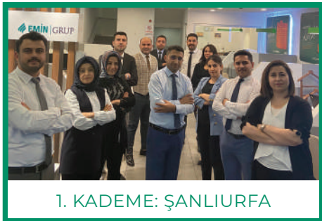
1. KADEME: ŞANLIURFA

İşte kademeler bazında yapılan sıralamaya göre Ekim ayının şampiyon şubeleri;