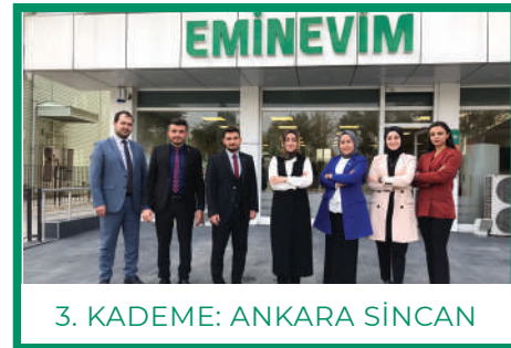
3. KADEME: ANKARA SİNCAN