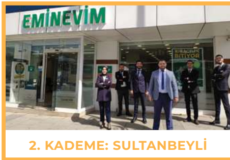
2. KADEME: SULTANBEYLİ