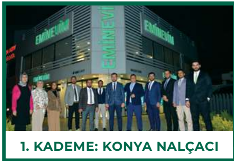
1. KADEME: KONYA NALÇACI

İşte kademeler bazında yapılan sıralamaya göre Ağustos ayının şampiyon şubeleri;