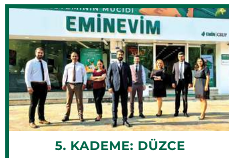
5. KADEME: DÜZCE