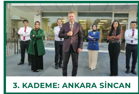
3. KADEME: ANKARA SİNCAN