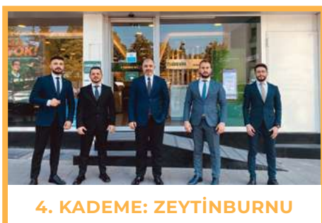
4. KADEME: ZEYTİNBURNU