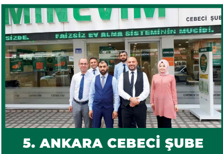
5. ANKARA CEBECİ ŞUBE