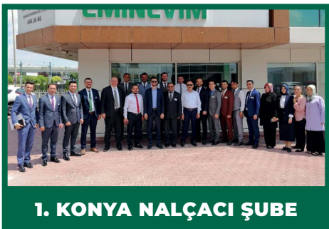
1. KONYA NALÇACI ŞUBE

İşte Haziran ayının en başarılı şubeleri;