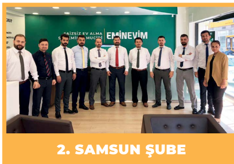
2. SAMSUN ŞUBE