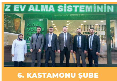
6. KASTAMONU ŞUBE