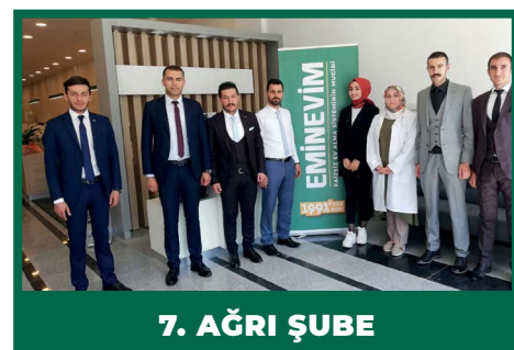
7. AĞRI ŞUBE