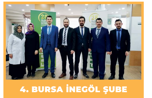
4. BURSA İNEGÖL ŞUBE