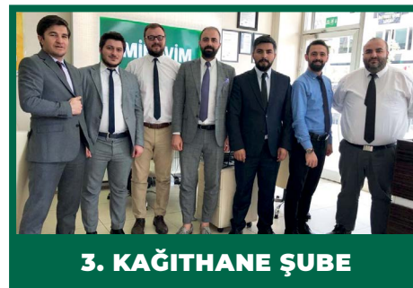
3. KAĞITHANE ŞUBE