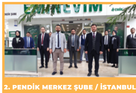
2. PENDİK MERKEZ ŞUBE / İSTANBUL