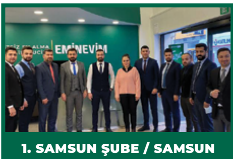
1. SAMSUN ŞUBE / SAMSUN

İşte kademeler bazında yapılan sıralamaya göre Aralık ayının şampiyon şubeleri;