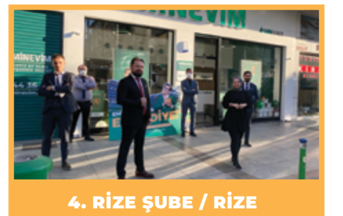
4. RİZE ŞUBE / RİZE