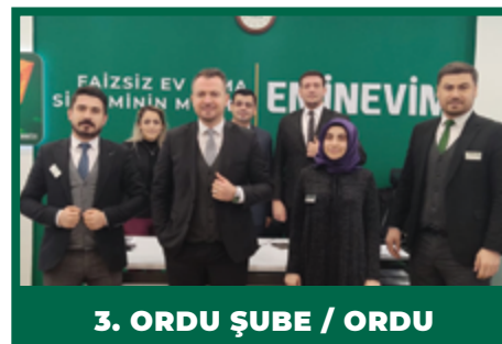
3. ORDU ŞUBE / ORDU