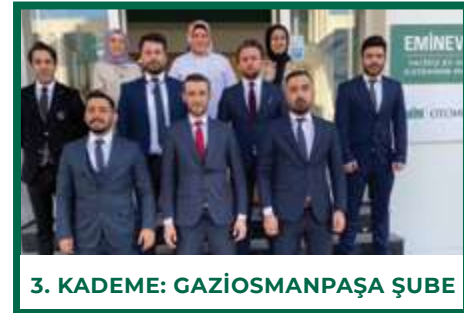
3. KADEME: GAZİOSMANPAŞA ŞUBE