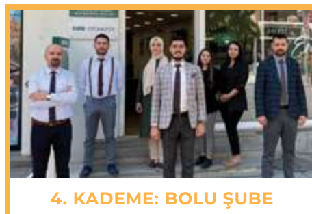
4. KADEME: BOLU ŞUBE