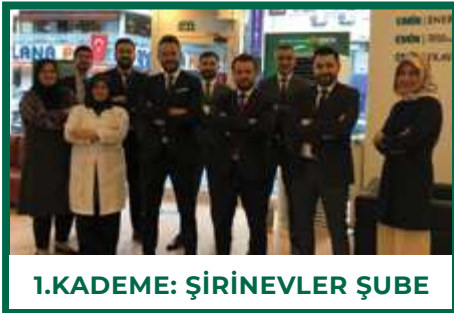
1.KADEME: ŞİRİNEVLER ŞUBE

İşte kademeler bazında yapılan sıralamaya göre Nisan ayının şampiyon şubeleri;