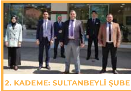
2. KADEME: SULTANBEYLİ ŞUBE