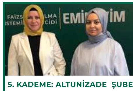
5. KADEME: ALTUNİZADE ŞUBE