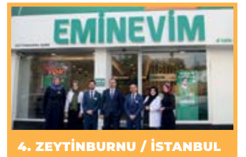
4. ZEYTİNBURNU / İSTANBUL