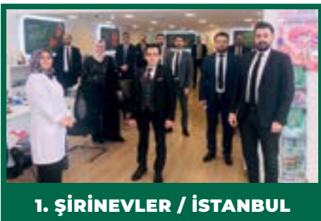
1. ŞİRİNEVLER / İSTANBUL

İşte kademeler bazında yapılan sıralamaya göre Nisan ayının şampiyon şubeleri;